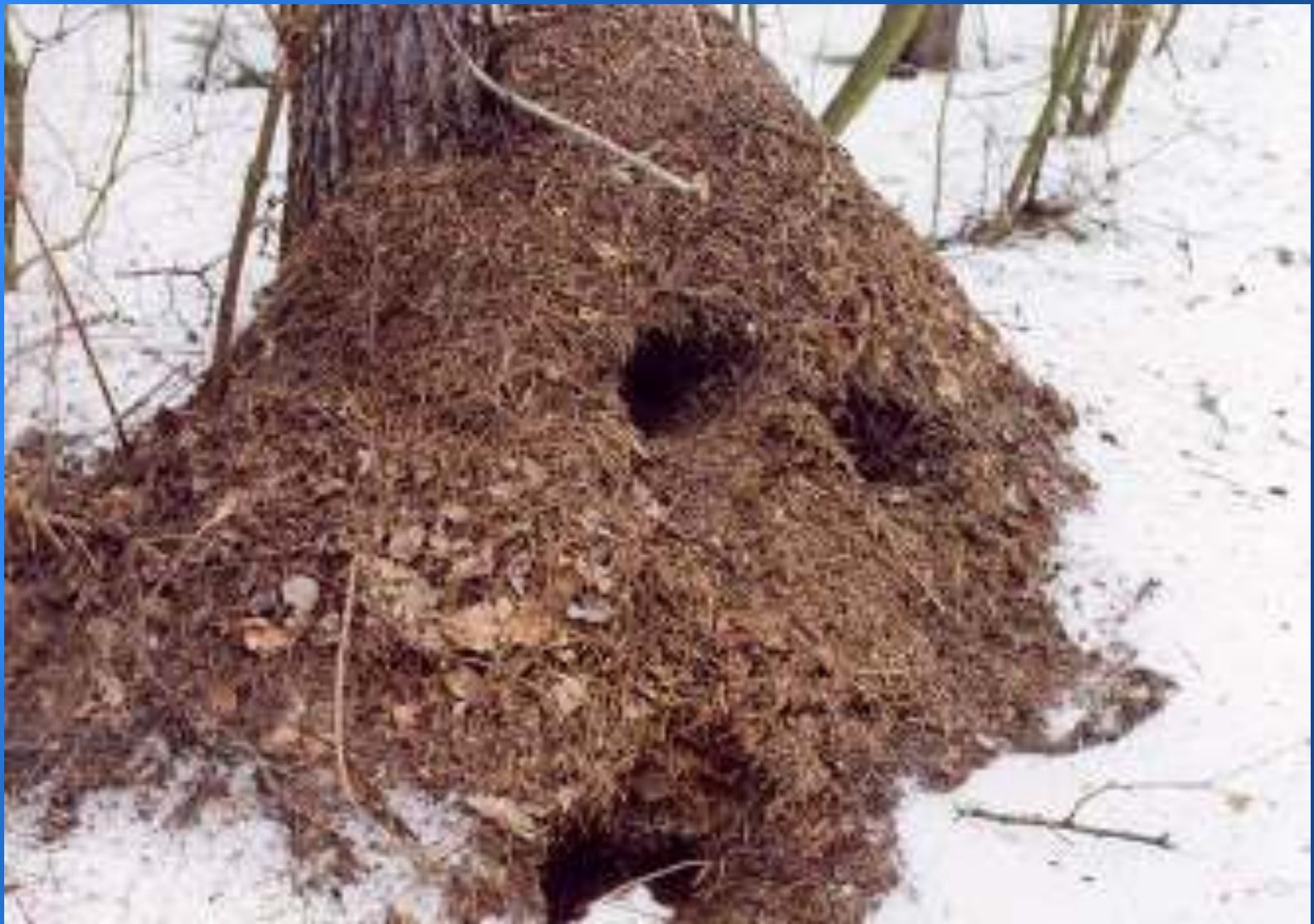
Работа дятла желна.