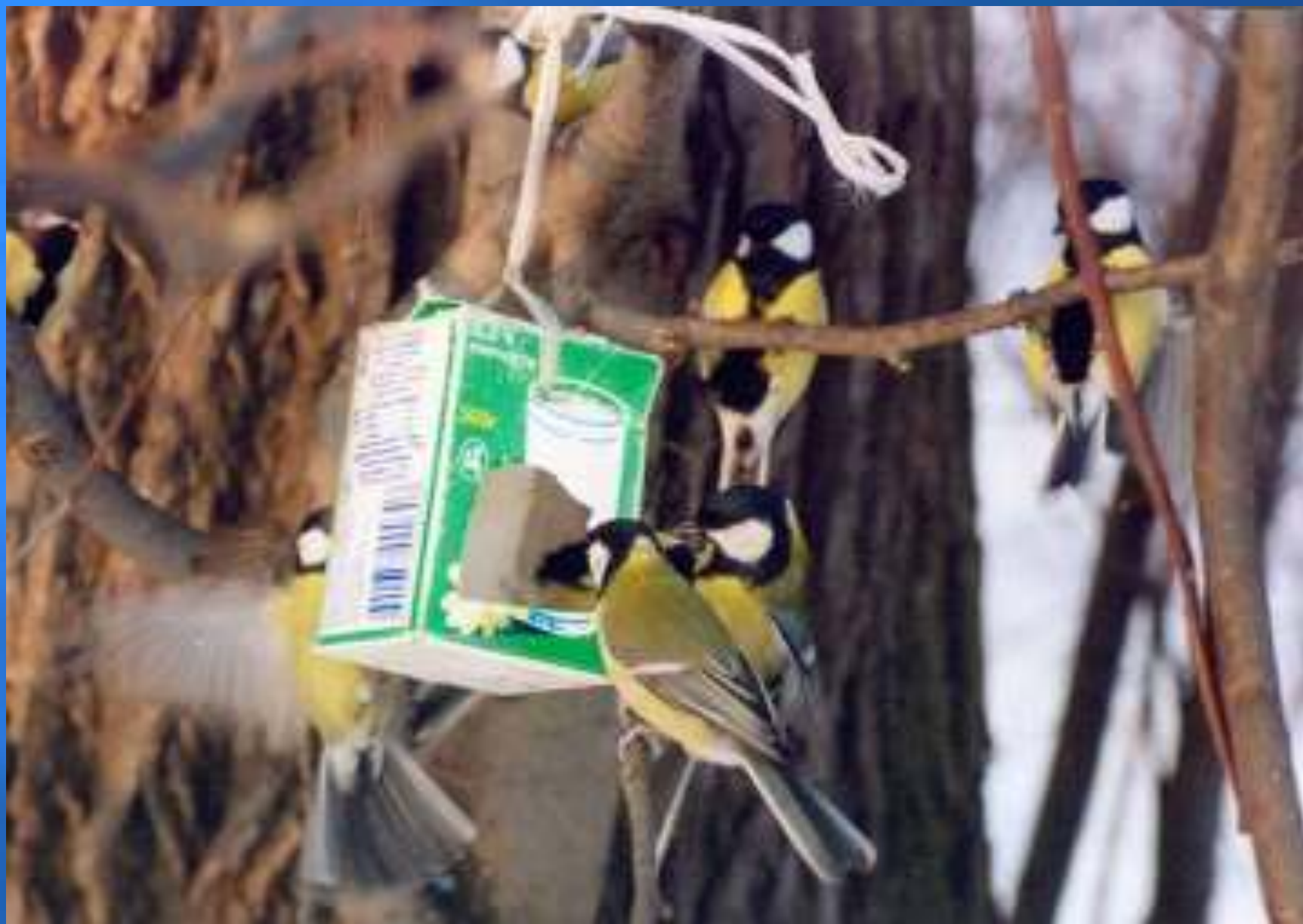
Перед стайкою синиц.